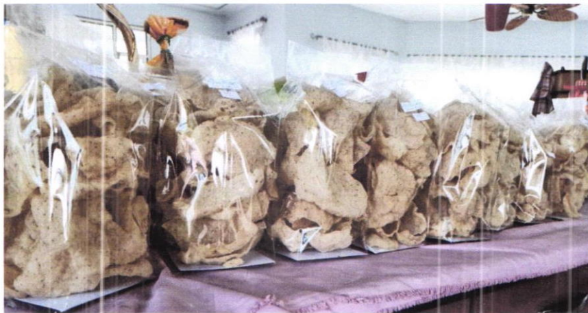
ข้าวเกรียบไข่ผ้า