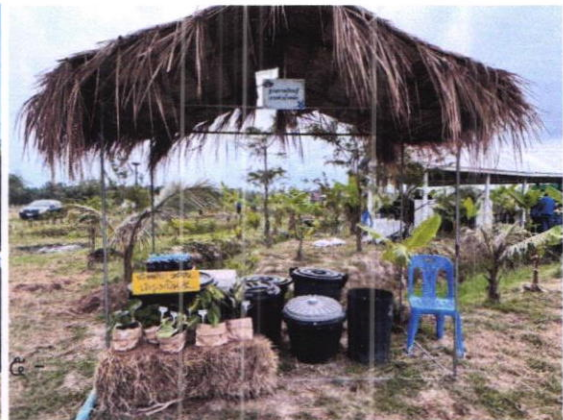
- มีการพัฒนาต่อยอดนำผลผลิตที่ได้จากแปลงโคก หนอง นา พัฒนาสู่ผลิตภัณฑ์ OTOP