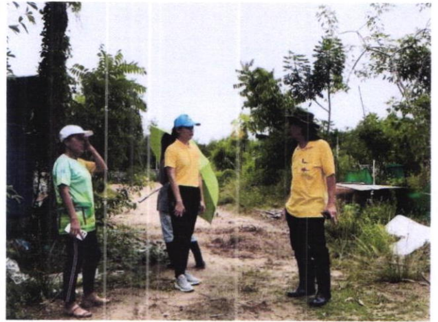
ปัจจุบันแปลงโคกหนองนา ได้ปลูกบัวในบ่อ และเลี้ยงเป็ด จำนวน ๓๐ ตัว

๒. การพัฒนาพื้นที่กลไกและเครือข่าย (People) ๗ ภาคส่วน ได้แก่ สำนักงานพัฒนาชุมชน อำเภอบ้านฉาง สำนักงานเกษตรอำเภอบ้านฉาง สำนักงานประมงอำเภอบ้านฉาง วัดสระแก้ว คำนัน ผู้ใหญ่บ้าน คณะกรรมการพัฒนาสตรีตำบล/อำเภอ กลุ่มบริษัทดาว สื่อมวลชนในพื้นที่อำเภอบ้านฉาง