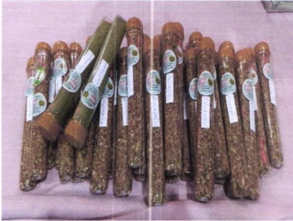
ผักไฮโดรโปนิกส์