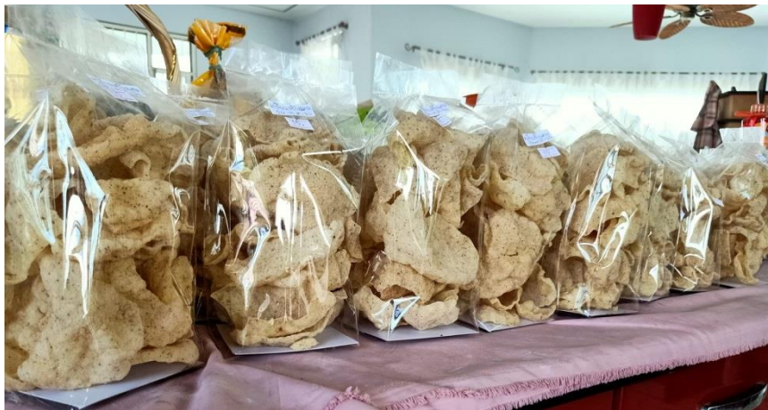
ข้าวเกรียบไข่ผ้า