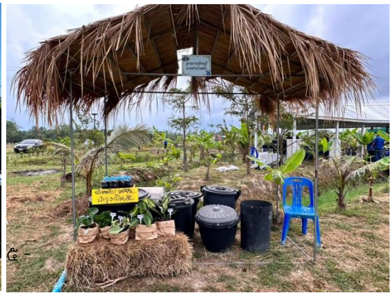
- มีการพัฒนาต่อยอดนำผลผลิตที่ได้จากแปลงโคก หนอง นา พัฒนาสู่ผลิตภัณฑ์ OTOP