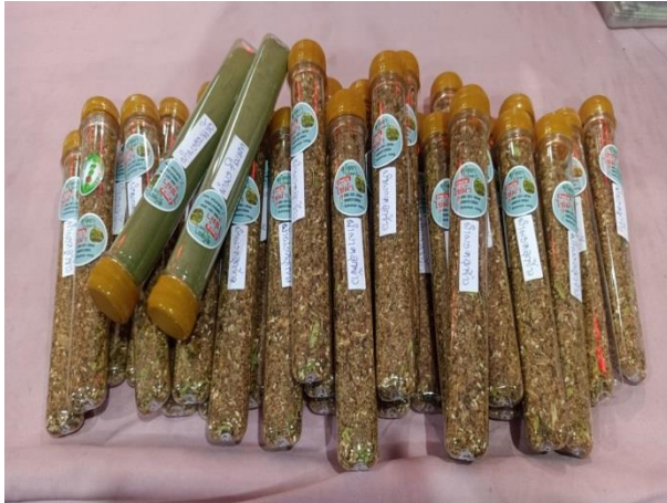
ผักไฮโดรโปนิกส์