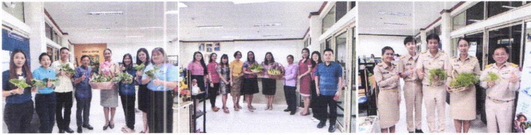
ปลูกผักบ้านพัฒนาการจังหวัดระยอง เพื่อร่วมแบ่งปันกัน