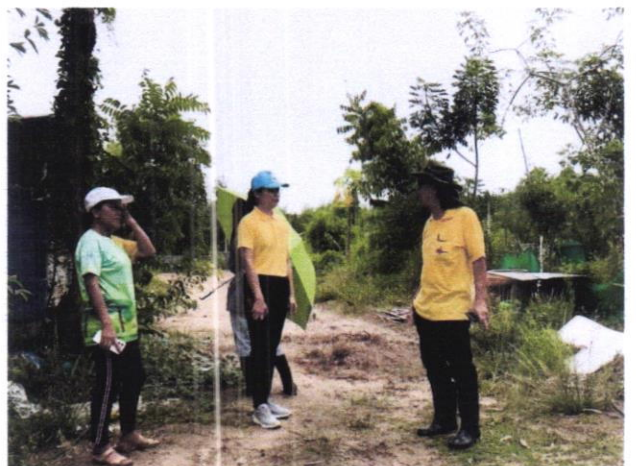
ปัจจุบันแปลงโคก หนอง นา ได้ปลูกบัวในบ่อ และเลี้ยงเป็ด จำนวน ๓๐ ตัว