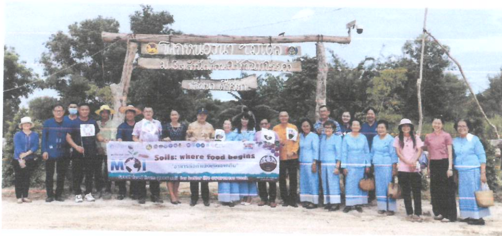
การจัดกิจกรรมเอามื้อสามัคคี เพื่อส่งเสริมสร้างความรัก ความสามัคคีในองค์กร สู่องค์กร แห่งความสุขและองค์กรคุณธรรม

๓. การพัฒนาผลิตภัณฑ์/ผลิตภัณฑ์ (Product) ได้แก่ หน่อไม้ น้ำส้มควั่นไม้ ดอกดาวเรือง ไข่เป็ด