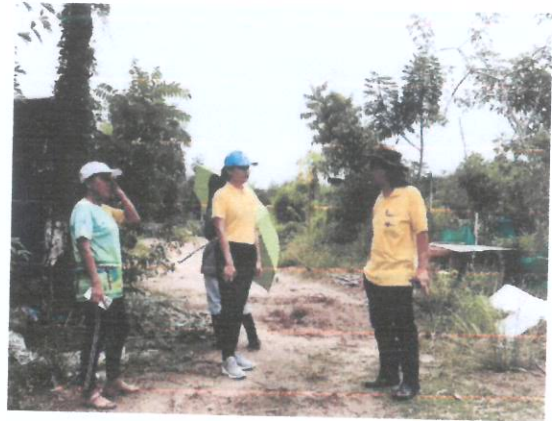
ปัจจุบันแปลงโคก หนอง นา ได้ปลูกบัวในบ่อ และเลี้ยงเป็ด จำนวน ๓๐ ตัว

๒. การพัฒนาพื้นที่กลไกและเครือข่าย (People) ๗ ภาคส่วน ได้แก่ สำนักงานพัฒนาชุมชน อำเภอบ้านฉาง สำนักงานเกษตรอำเภอบ้านฉาง สำนักงานประมงอำเภอบ้านฉาง วัดสระแก้ว กำนัน ผู้ใหญ่บ้าน คณะกรรมการพัฒนาสตรีตำบล/อำเภอ กลุ่มบริษัทดาว สื่อมวลชนในพื้นที่อำเภอบ้านฉาง